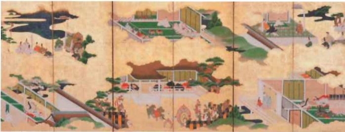
源氏物語絵図屏風