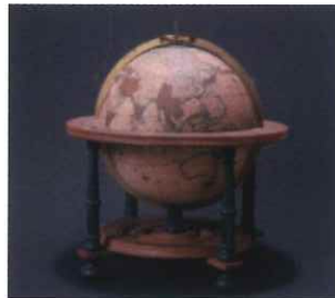
地球儀 ファルク工房(オランダ) 1700年