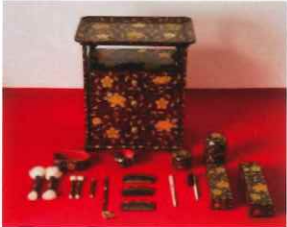
梅鉢紋散牡丹唐草蒔絵餐台