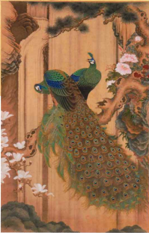
孔雀之図 徐暉晋 筆

本展を通じて、平戸松浦家が歩んできた歴史を知り、佐世保の皆さまに平戸をより身近に感じていただければ幸いです。