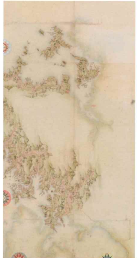
伊能図 (佐世保・松浦)