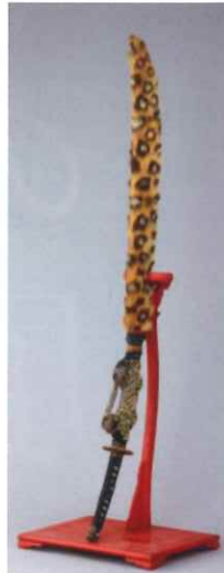
三星梶葉入糸巻太刀拵