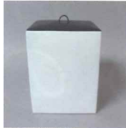
四方水指(鶴ヶ峰焼)