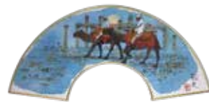
《パルミラの遺跡》2008年