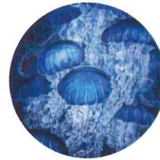
タケウチハルナ 日本画 イラストレーション他