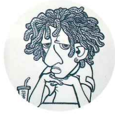
田崎 章碁 アクリル画 イラストレーション