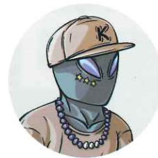
RYOMEE イラストレーション