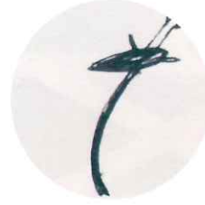
野田 砂漠 イラストレーション 写真