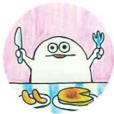
URARA イラストレーション

「百花斉放展」では日本画・油絵・ペン画などからデジタルイラスト、立体物など色々な作品を展示しています。今年も元気に咲いた花々のような作品たちを是非ご覧ください。作品はもちろん、一人ひとりの展示スペースごとに変わる世界観もお楽しみください。