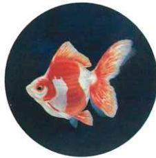
坂根 知世 絵画