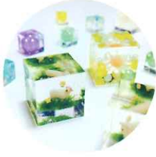
たま イラストレーション ネイルアート