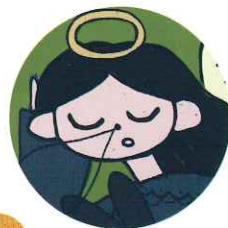
popoink. イラストレーション