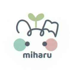
みはる イラストレーション 豆本